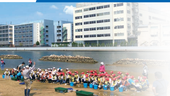
兵庫運河での環境学習