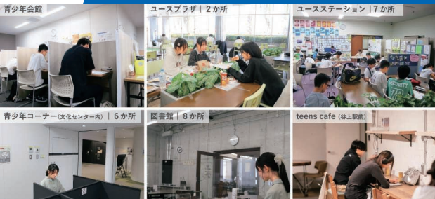
先行実施した自習室(神戸市資料より)