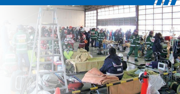
DMATによる被災者支援

DMAT(Disaster Medical Assistance Team)は、阪神・淡路大震災をきっかけに迅速に医療支援を行うため医師、看護師などで構成され、災害発生直後のおおむね48時間以内から活動できる機動性を持った専門的な訓練を受けた医療チーム