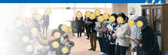
中学生が考える防災訓練

他都市では、中学生を自治会役員に、そして高校生、大学生も加わる自治 会に! 兵庫区でも中学生が考える防災訓練。子どもに人気の英語教室に兵 庫区在住外国人の参加により英会話とコミュニティの両立へ (詳しくは、P4 をご参照ください)