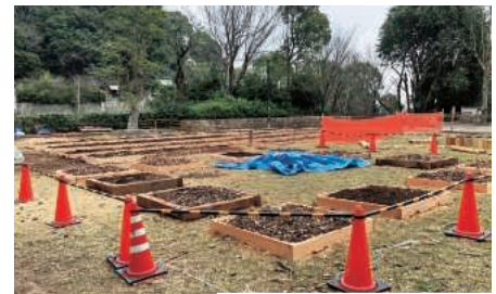
平野展望公園 農業体験施設準備中